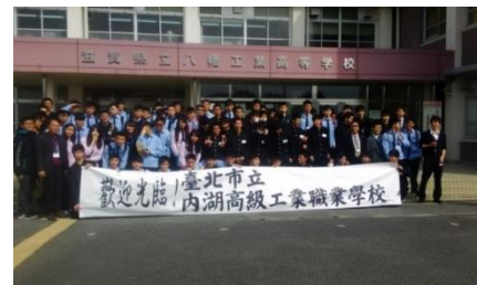
県立八幡工業高校