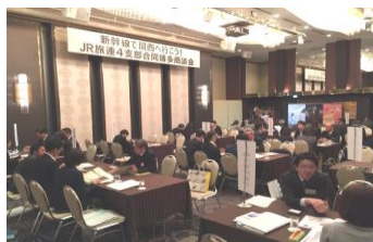
10 月 26 日 博多商談会