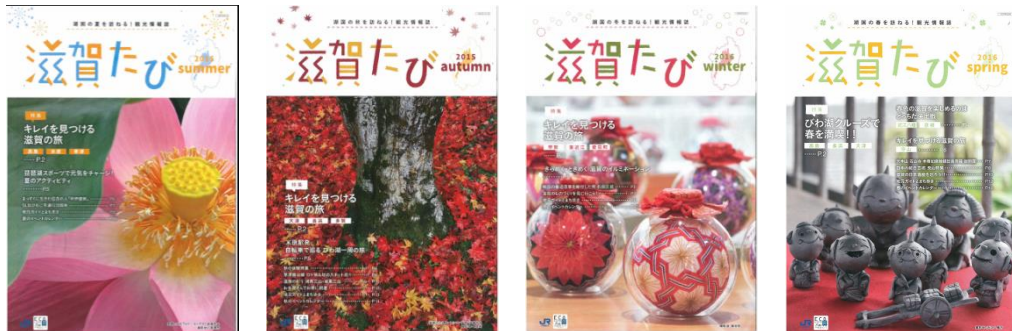
《滋賀たび情報誌》パンフレット（A4 12～16P） 15万部発行 （駅9万部、県内3万部、他3万部） ※JR西日本全エリアの主な駅に掲出