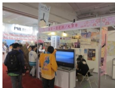
ベトナム・ジャパンフェスティバル