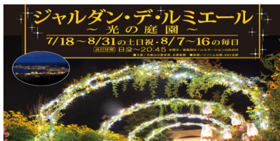
(ジャルダン・デ・ルミエール ～光の庭園)