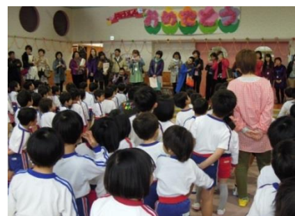
滋賀短期大学附属幼稚園