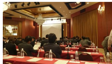
12 月 2 日 福岡素材説明会