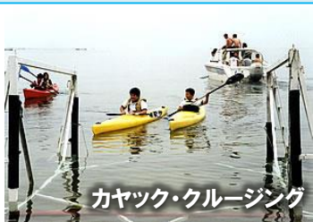
カヤック・クルージング